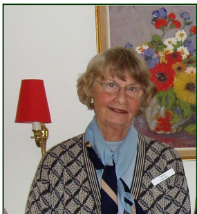
Lone er frivillig på Ordruplund